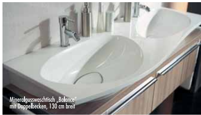
Mineralgusswaschtisch „Balance“ mit Doppelbecken, 130 cm breit