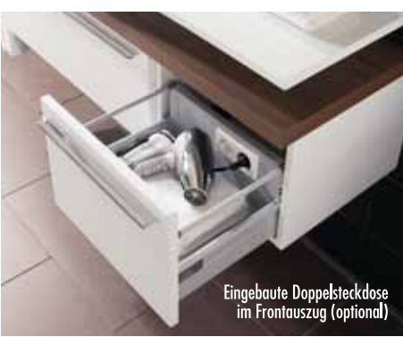
Eingebaute Doppelsteckdose im Frontauszug (optional)

Schon der Name ist Programm – denn ausgeglichen wirkt BALANCE auf den ersten Blick.