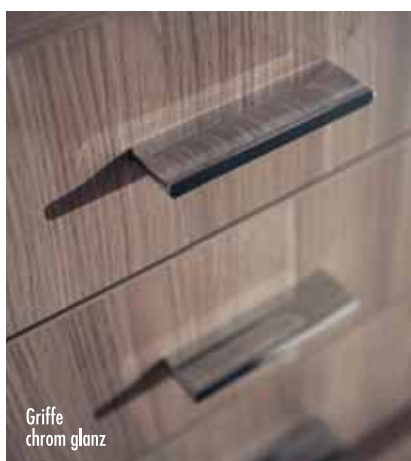
Griffe chrom glanz

Ausgabe 01/2009 Die genannten Maße sind Circa-Angaben. Irrtümer und technische Änderungen vorbehalten. Die abgebildeten Farben/Oberflächen können aus drucktechnischen Gründen vom Original abweichen.