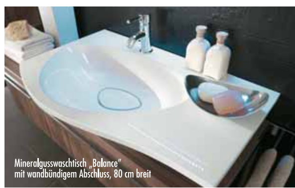
Mineralgusswaschtisch „Balance“ mit wandbündigem Abschluss, 80 cm breit